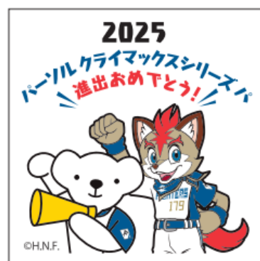
※ 写真はイメージです