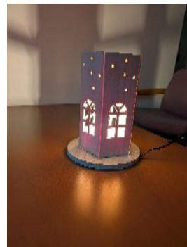
道の駅おんねゆ温泉での木エクラフト体験(イメージ)