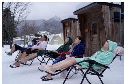
道産材で作られたサウナ(イメージ)