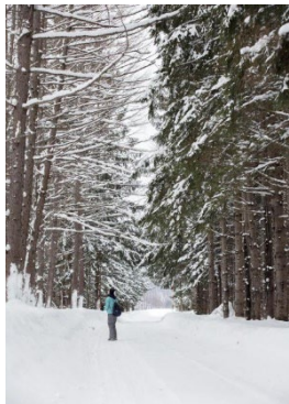
おんねゆの森をガイドが案内する早朝ウォーク(イメージ)

(注1)「リトリート」とは、仕事や生活から離れた非日常的な場所で自分と向き合い、心と体をリラックスさせる新たな旅の過ごし方です。おんねゆが持つ地域資源に加え、オホーツク内陸部ならではの雪景色や寒さも体験できるプログラムの中から、好きな体験をチョイスし、地域の歴史や自然を感じながら癒しの時間をご堪能いただけます。