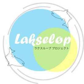
Lakseløp プロジェクト ロゴマーク

※上記内容は、特設サイト( https://www.airdo.jp/corporate/recruit/lakse/ )にてご確認いただけます