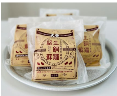
生銅鑼紹蘇(なまどらろっそ)