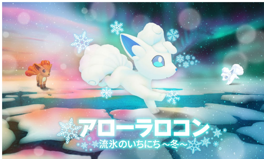
オホーツク流氷館における映像演出(イメージ)