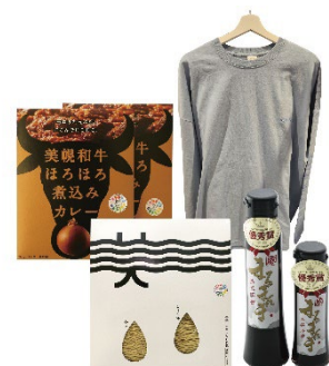
美幌町特産物セット

© Pokémon. © Nintendo/Creatures Inc./GAME FREAK inc.