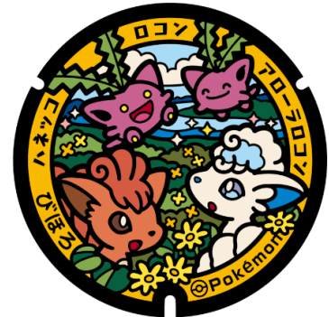
美幌町 (アローラロコン・ロコン・ハネッコ)