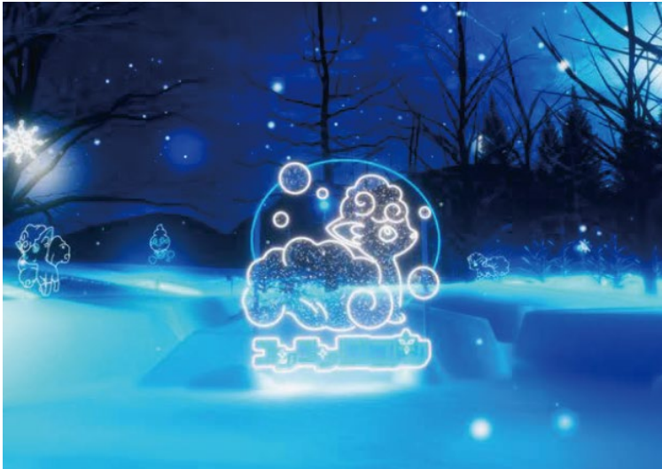
メインイルミネーション(イメージ)