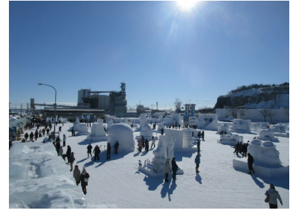
過去の流氷まつりの様子

期間：2024年2月10日(土)11日(日) 時間：10:00～20:00(最終日は16:00まで) ※ 「ポケふた」氷の滑り台・かまくらの利用は両日16:00終了予定 ※ 天候等の状況により時間短縮の場合があります 場所：網走商港埠頭会場(北海道網走市港町5番地)