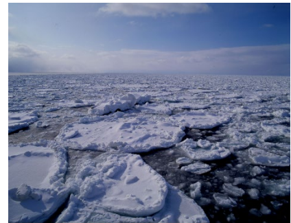
本物の流氷が当たる！