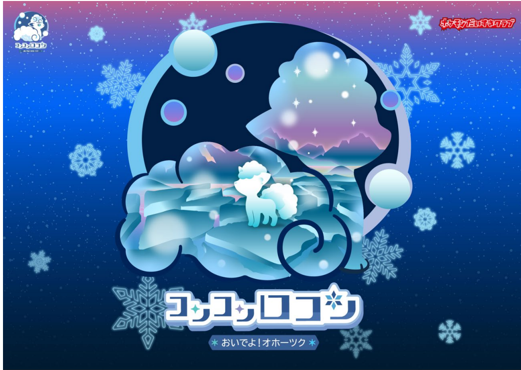
「コンコンロコン おいでよ！オホーツク」メインビジュアル

「北海道の推しポケモン」アローラロコン・ロコンと冬のオホーツクを楽しもう！ 本物の流氷 20kg が当たるスタンプラリーも同時開催！！