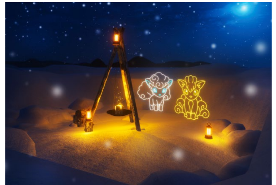
アクティビティスポット(イメージ)