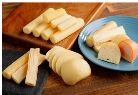
ひがしもと乳酪館チーズ盛り合わせ