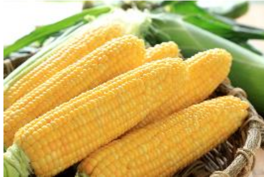
スイートコーン「ゴールドラッシュ」

サカタのタネが開発したスイートコーン「ゴールドラッシュ」は 2004 年に発売したスイートコーンで、通常品種と比べ甘みや粒皮の薄さなど食味がよだけでなく、栽培しやすさにも優れているため、スイートコーンの大産地である北海道でも高いシェアを誇ります。JA 道北なよろは「ゴールドラッシュ」に力を入れている産地の一つで、昼夜の寒暖差を生かして栽培されたスイートコーンは、ギュッと詰まった甘みとジューシーではじける食感が特長です。