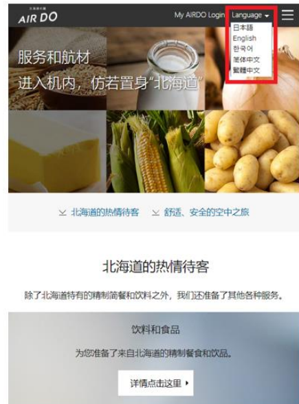
【言語選択 PC／スマートフォン】