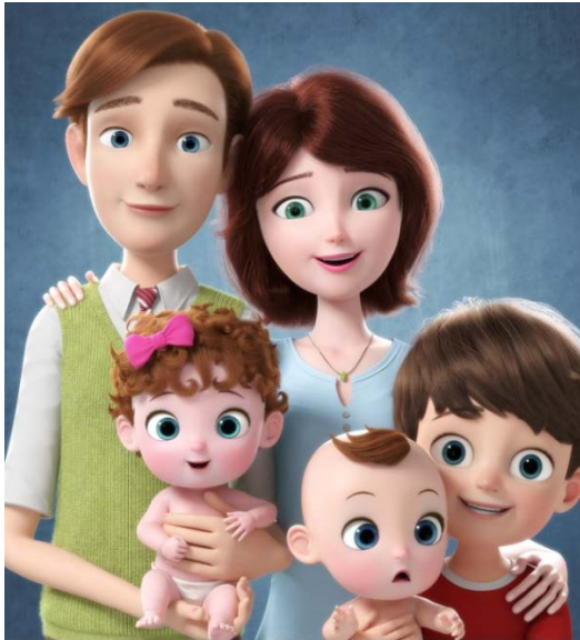
※イメージ映像です

上記に加えて、画面の字幕サイズを従来の 1.2 倍に拡大し視認性を高め、聞きやすいナレーションを採用するなど、すべてのお客様に安全情報をより正しくご理解頂ける内容となっています。