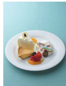
「奇跡の口どけセット ～AIRDO×LeTAO20th～」 ふわふわな生ドゥーブルと滑らかなヴェネチアランデヴーにミルク感たっぷりのオリジナル生クリームを添えてよりミルキーで口どけ豊かなセットになっています。