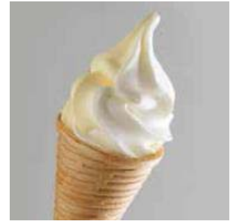
「クレームグラッセ マリアージュ」 北海道産ジャージーミルクを使用した ソフトと、チーズソフトのミックス