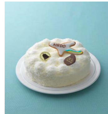
「エア・ドゥーブル」 ミルキーでふわふわの生ドゥーブルとエア・ドゥの空をイメージしたドゥーブルフロマーージュです。

また、ルタオ本店2階の喫茶では、人気NO.1の「奇跡の口どけセット」をこの日限りの限定仕様で100セットご用意しております。