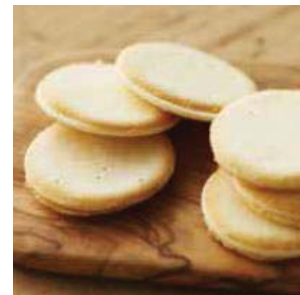
「小樽色内通りフロマージュ」 チーズ、バター、チョコレートが調和した ラングドシャクッキー