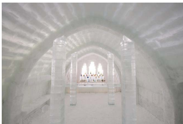
アイスバー(然別湖コタン)