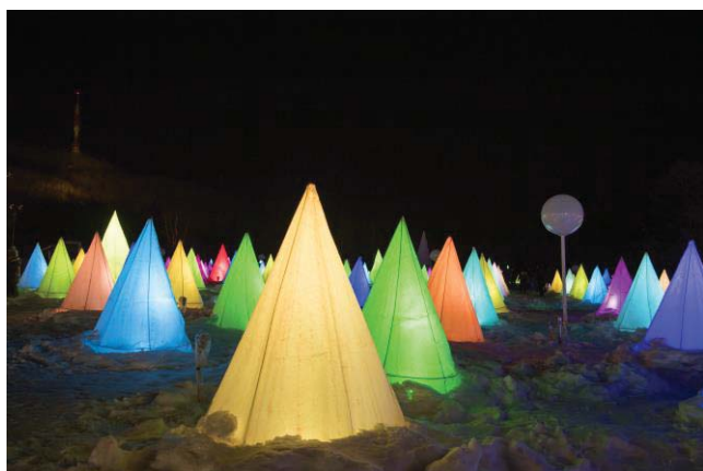
彩凜華(十勝川温泉)