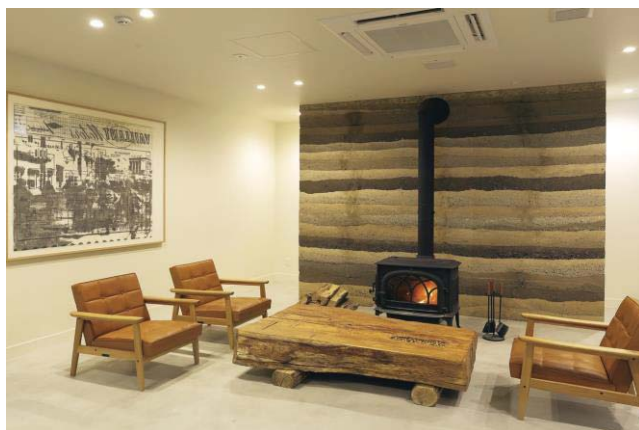
ホテル NUPKA(賞品 B)