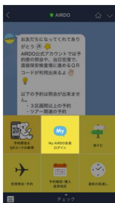
「My AIRDO 会員ログイン」 をタップ

エア・ドウ LINE 公式アカウントへご登録いただき、以下のフローにて「会員連携」を行ってください。