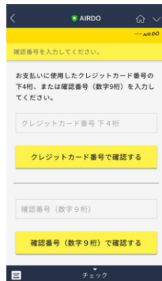
確認番号(9 桁)または クレジットカード下 4 桁を入力(注)