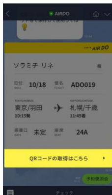
「QR コードの表示はこちら」 をタップ

LINE 上で QR コードを取得する場合、従来の「確認番号(9 桁)」に加え、新たに決済いただいたクレジットカード番号の下 4 桁でも、QR コードを取得することが可能となります。