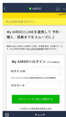
「My AIRDO」ログイン ID ・パスワードを入力