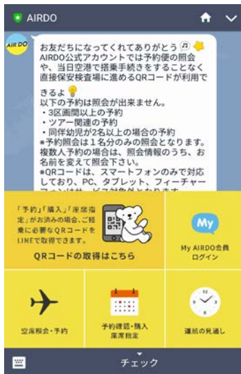
【トーク画面のサービスマニュー】