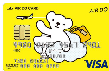
クラシックカード（ベア・ドウ デザイン）