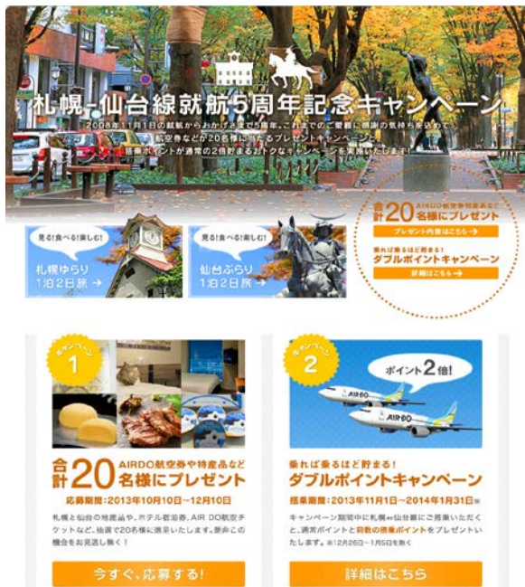
【キャンペーン画面】