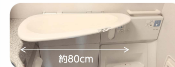
例: B767の中央右の化粧室

機内には、おむつ交換台付きの化粧室があります。 ※スペースが限られますので、空港の化粧室で交換しておくとお安心です。 ※機材によって設備は異なります。