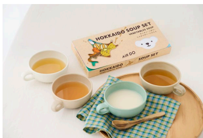
【北海道スープ4種セット】