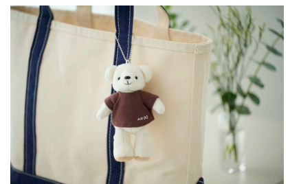
【マスコットベア・ドウ】